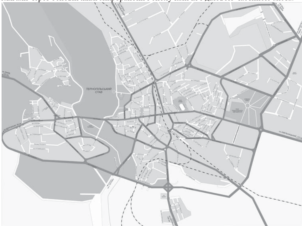
Рис.ХІІІ.1 Схема автодоріг м.Тернополя (темним кольором показані найбільш завантажені автошляхи)

Водночас необхідно розширювати, а не зменшувати площі зелених насаджень у