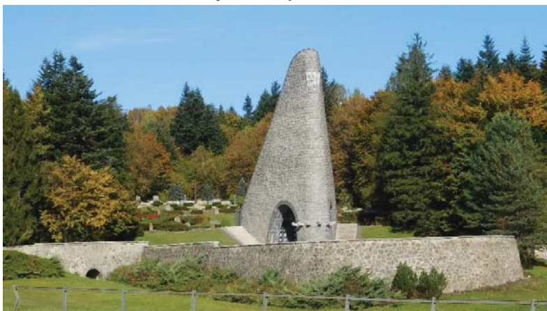
Obr. 2: Pamätník a cintorín československej armády na Dukle

Najznámejším symbolom je Pamätník a cintorín československej armády na Dukle (obrázok 2). Pamätník je národnou kultúrnou pamiatkou a má ľuďom pripomenúť udalosti z roku 1944, keď sovietski a československí vojaci bojovali za našu slobodu. Súčasťou pamätníka je aj cintorín, kde sú pochovaní padlí československí vojaci a významní velitelia Karpatsko-duklianskej operácie. Dominantou cintorína je pylón s obradnou sieňou, vysoký 28 m, nachádzajúci sa v južnej časti cintorína. Má klinovitý tvar, čo symbolizuje hlavný útok do nemeckej obrany a tiež bránu slobody. Na vrchu stavby je umiestnený československý znak, ktorý symbolizuje súdržnosť českého a slovenského národa v čase bojov za slobodu. V kolumbáriu (vyzdobený priestor pamätníka) sú vyryté miesta bojov 1. československého armádneho zboru od Sovietskeho zväzu až po Prahu. V strede pamätníka stojí bronzová socha československého vojaka v nadživotnej veľkosti (2,4 m vysoká) vzdávajúci hold „poctou zbraň“ pochovaným. Na cintoríne je pochovaných 563 príslušníkov československého armádneho zboru. V severnej časti lemuje cintorín betónový múr, na ktorom sú umiestnené busty významných veliteľov vojsk [8].