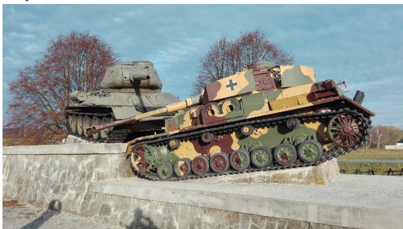
Obr. 3: Tanky pri vstupe do Údolia smrti

Mikroregión Údolie smrti sa nachádza na južných svahoch Nízkych Beskýd a svoj názov získal podľa ťažkých bojov, ktoré sa na tomto území odohrali v novembri 1944. Tvorí ho deväť obcí, ktorými sú Kapišová, Dobroslava, Vyšná Pisaná, Nižná Pisaná, Kružlová, Svidnička, Vápeník, Dlhoňa a Havranec. Pri vstupe do Údolia smrti sa nachádzajú dva objekty, ktorými sú Pomník trom československým ženistom, ktorí zahynuli pri odmínovaní podduklianskeho regiónu a exponát predstavujúci sovietsky tank T-34/85, ktorý drví pod svojimi pásmi nemeckého „Panthera“ [10]. Názov tohto exponátu je Taran (obrázok 3).