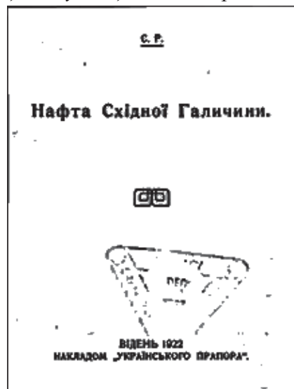
Рисунок 1. Титульний лист праці С. Рудницького «Нафта Східної Галичини» (Відень, 1922)

Для широкої аудиторії наукової спільноти праця ученого стала доступна з жовтня 2011 р., після її оприлюднення в оцифрованому вигляді на порталі електронної бібліотеки Diasporiada.org.ua , який спеціалізується на популяризації та збереженні для майбутніх поколінь наукової спадщиною українських вчених початку ХХ ст.