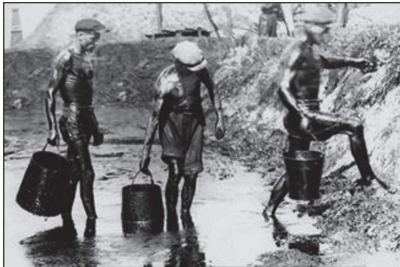
Рисунок 3. Нафтовидобуток в Східній Галичині, початок ХХ ст.

У цьому розділ учений згадує про перші техногенні катастрофи, які виникають у результаті розвитку нафтових промислів на теренах Східної Галичини: «Пр. східницька дуча «Яків» затопила славним своїм вибухом 1895 р. цілу околицю в промірі \frac{1}{2} кілометра величезними масами кипячки» [9, с. 12] та пояснює їхні причини: «Експльозивну силу до таких вибухів дають гази, що випирають ропу в гору» [9, с. 12].