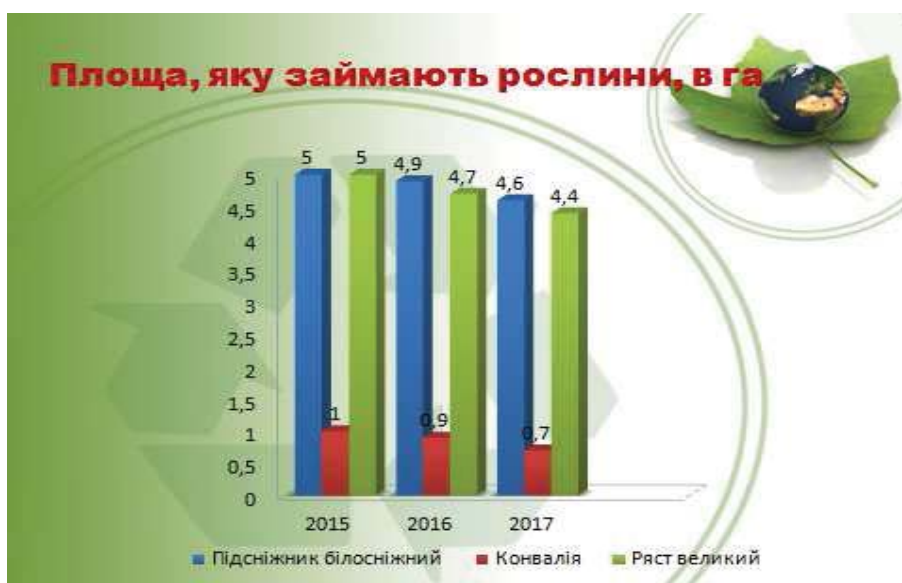
Рис. 3. Площа, яку займають рослини

Долина Вуглярки отримала свою назву саме через те, що там випалювали вугілля. А долина Біля криничок – через велику кількість джерел, які забезпечували урочище вологою, що сприяло формуванню різноманітного рослинного світу. Площа долин – 22 га. Лісові насадження в основному представлені ділянками сосни європейської, граба звичайного, берези звичайної.