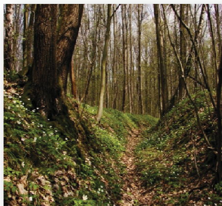
Рис. 2. Схили урочища Мурована

Урочище Мурована знаходиться на північному сході від села Мала Іловиця Шумського району Тернопільської області. (рис.2) Його площа – 43га. На півночі Мурована межує із урочищем Запустом, яке переходить у так званий у народі «Ганчин горбочок». Урочище умовно поділене на 4 долини, розділені дорогою, – Розділ, Провалля, Вуглярки, Біля криничок. А на південному заході Мурована межує з урочищем Гострогіркою і тягнеться вздовж нього.