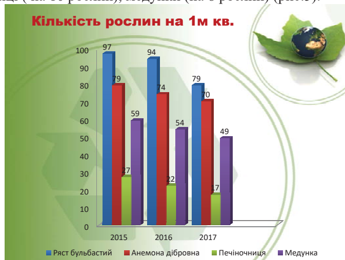
Рис. 5. Кількість рослин на 1м 2

Дана діаграма відображає зміну кількості рослин , а саме таких первоцвітів як ряст бульбастий, анемона дібровна, печіночниця, медунка на 1 м 2 . За 2015 – 2017 роки майже не змінилась чисельність рясту бульбастого ( зменшилась на 18 рослин на 1 м 2 ), анемони дібрової (зменшилась на 9 рослин), печіночниці ( на 10 рослин), медунки (на 8 рослин) (рис.5).