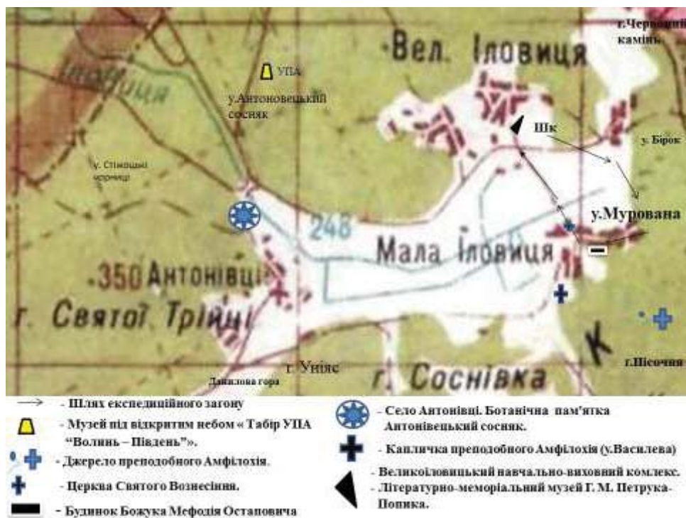
Рис. 1. Фрагмент карти Шумського району

Протягом тривалого часу чимало людей цікавились походженням назви урочища. Інтерес до цього мікротопоніма не згас і сьогодні. За словами пана Мефодія, «старі люди казали, що свою назву воно дістало від місця знаходження (а знаходиться урочище між великими горбами, які наче «мури» захищають його, і має воно лише один вхід), що і вплинуло на формування флори і фауни цієї місцевості. У долинах урочища місцеві жителі палили вапниці, тут же випалювали і вугілля, навіть сьогодні можна знайти кусочки вугілля тих часів.