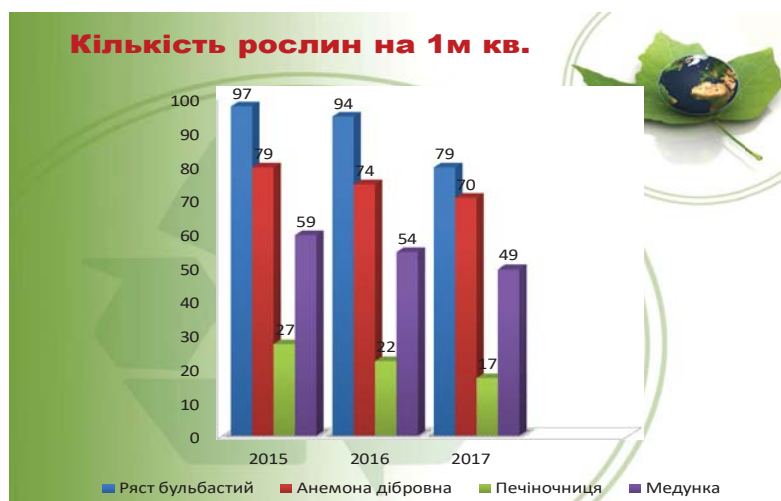
Рис. 4. Кількість рослин на 1 м 2

Урочище Мурована стало «домівкою» для різних видів тварин: тут можна зустріти кабана дикого, козулю, лисицю, борсука, зайця, ласку, тхора, летючу мишу, вовка сірого, сову, дятла малого, сойку; для багатьох плазунів (мідянки, вужа, різних видів гадюк), а також для земноводних та членистоногих.