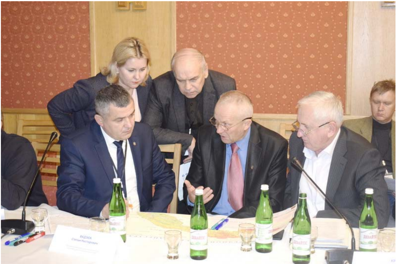
Зібрання представників водогосподарської галузі, органів місцевої влади і самоврядування та громадськості з 7-ми областей України (Тернопільської, Львівської, Івано-Франківської, Чернівецької, Хмельницької, Вінницької, Одеської), щоб сформувати склад басейнової ради Дністра (15 листопада 2018 року)