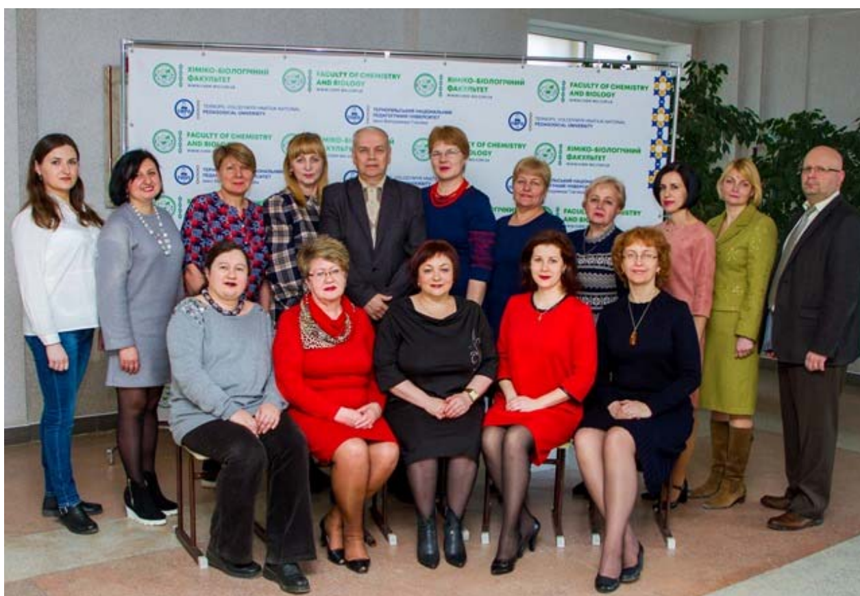
Кафедра загальної біології та методики навчання природничих дисциплін