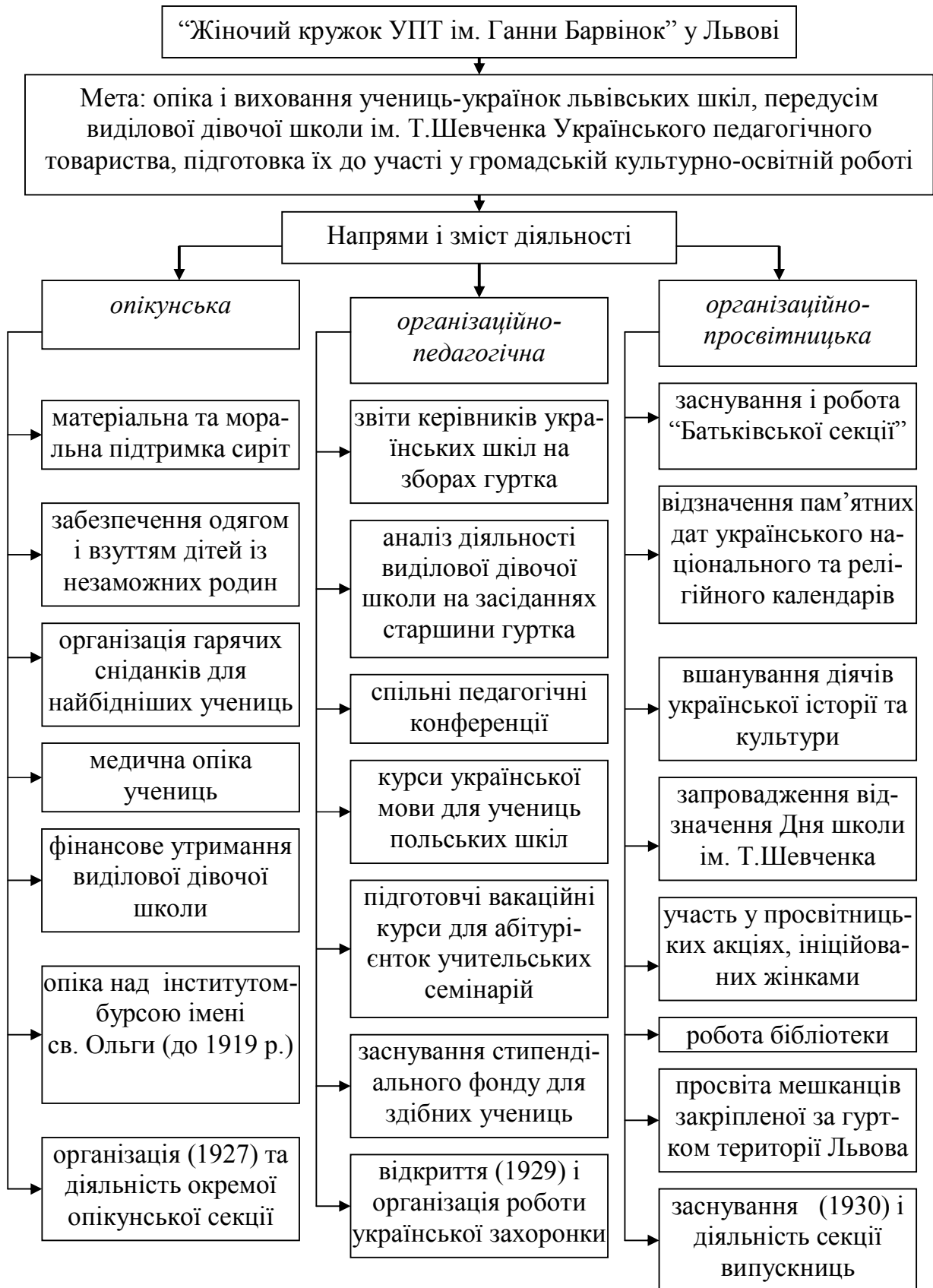
Рис.2. Напрями та зміст позашкільної діяльності “Жіночого кружка УПТ ім. Ганни Барвінок” у Львові (1912-1939).