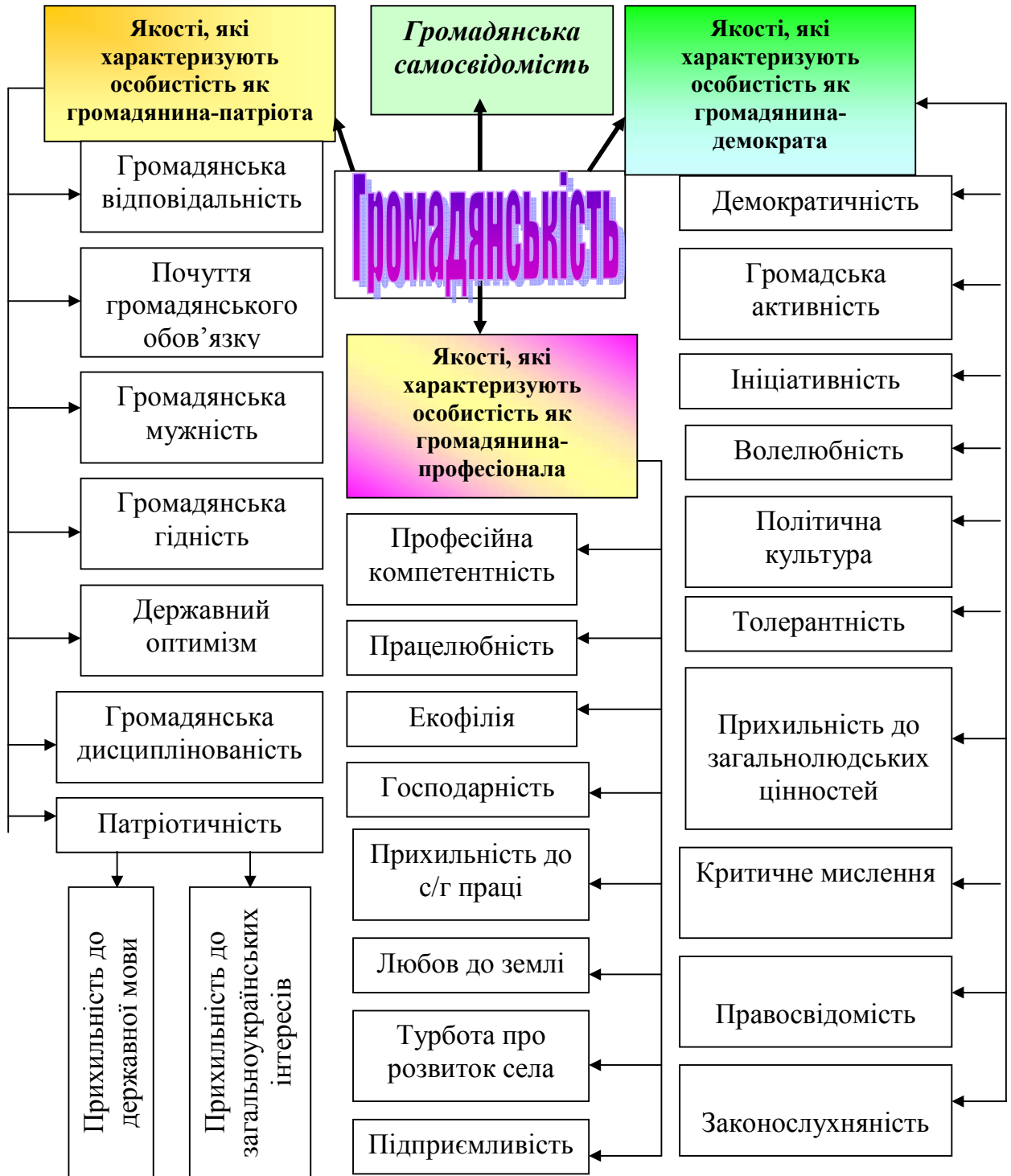
Рис.1. Модель громадянськості студентів вищих аграрних навчальних закладів

Специфіка громадянськості студентів ВАНЗ відображена у блоці – якості, які характеризують особистість як громадянина – професіонала. До зазначеного блоку громадянських якостей віднесено: екофілію – оскільки одним із основних факторів забруднення навколишнього середовища в Україні є с/г діяльність людини; працелюбність – беручи до уваги сезонність с/г робіт; любов до землі