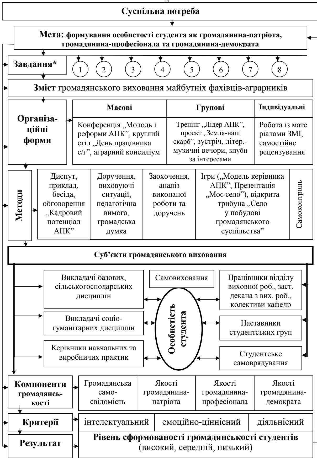
Рис. 2 Модель технології формування громадянськості студентів - аграрників