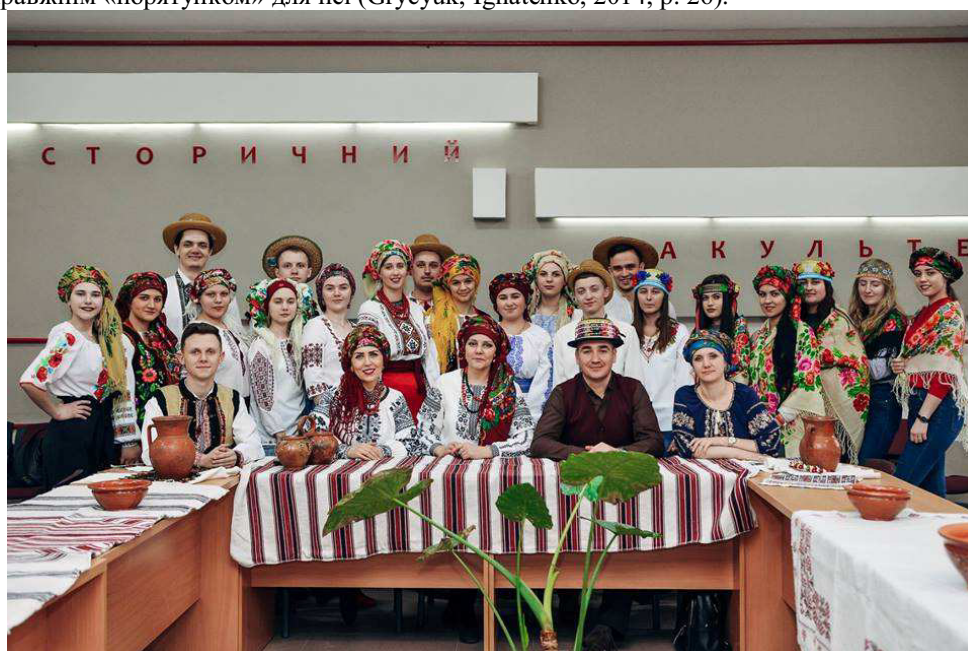
Інтерактивна зустріч «Благословенна Богом українська жінка» (історичний факультет Тернопільського національного педагогічного університету ім. В. Гнатюка, 6.03.2019 р.)