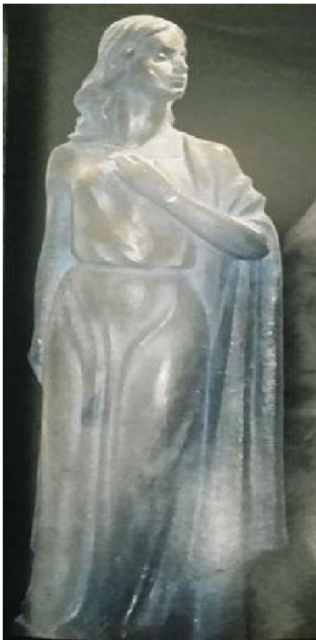
В. Мельник. Соломія на сцені. 1986. Гіпс тонований.

Її життя тісно пов'язане із Тернопільщиною. Тут її батьківщина, саме тут у 1883 році на Шевченківському концерті в Тернополі відбувся перший прилюдний виступ Соломії, яка співала в хорі товариства «Руська бесіда».