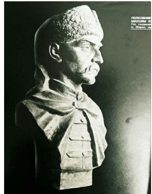
В. Мельник. Полковник Війська Запорозького Максим Кривоніс. м. Збараж, музей. 1993. Гіпс тонований.

Вражають глибоко-психологічні скульптурні портрети гетьмана України Івана Мазепи, полковника війська запорізького Нестора Морозенка, Максима Кривоноса, пам'ятник Дмитру Клячківському, інших героїв. Вражають не зовнішньою подібністю, а емоціями, відображеними у поглядах, нахмурених бровах. Споглядаючи ці портрети, відчуваєш їхні печалі, біль та сум, роздуми про щось споконвічне.