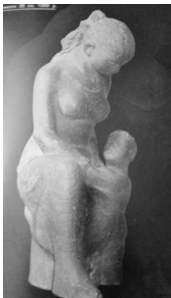
В. Мельник. Мати. 1996. Керамічна маса.

Маловідомими є роботи В. Мельника, пов'язані із оформленням приміщень. У дослідженні кераміки