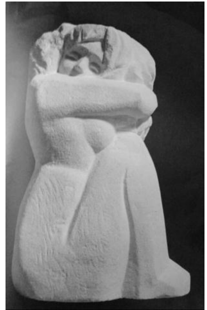
В. Мельник. Самотність. Камінь.

Життя цієї талановитої жінки обірвалось 10 березня 2006 р., що також наклало відбиток на творчість Володимира Михайловича. Він відтворив її світлий образ і у скульптурі, і в живописних роботах. поглядаючи «Портрет дружини», відчуваємо сум та біль утрати автора, його тугу за рідною