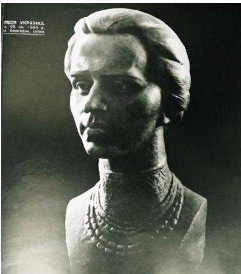
В. Мельник. Леся Українка. м. Березжани, музей. 1984. Гіпс тонований.

бачення того чи іншого образу. Так, перед нами той О. Маковей і та Л. Українка, яких ми знаємо зі шкільної парти, той хрестоматійний Шевченко, до якого звикли наші очі