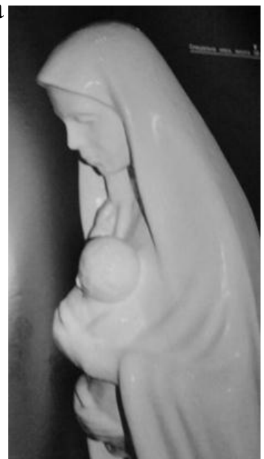
В. Мельник. У Вифлеємі. 1999. Спеціальна маса.

Ці ж слова можна сказати і про тему материнства, зрештою, сирітства. Напевне тому такий значний доробок В. Мельника у цьому творчому напрямі. Все, що наболіло у душі відображено у творах, присвячених матері: «Материнська дума» (1978), «У Вифлеємі...» (1999), «Мати» (1986), «Туга» (1973), «Різдво» (2001) та ін.