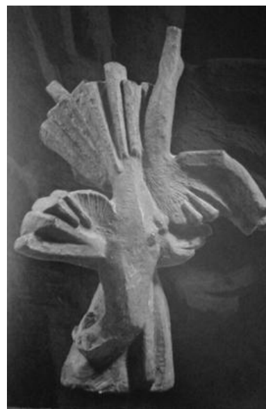
В. Мельник. Два птахи. 1988. Керамічна маса.

Західного Поділля кінця ХІХ – ХХ століття С. Вольська з'ясувала, що В. Мельнику притаманні і такі роботи. Так,