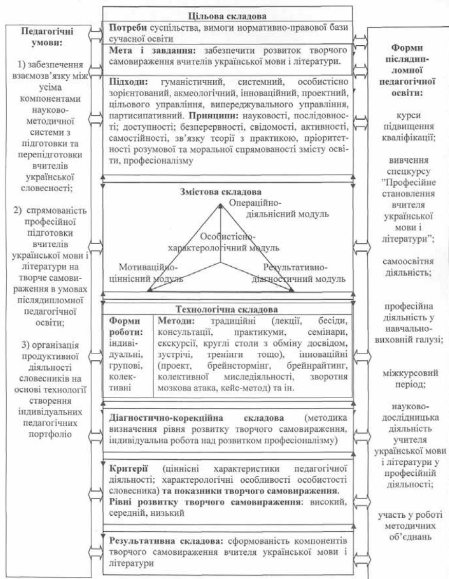
Рис. 1. Структурна модель розвитку творчого самовираження вчителя української мови і літератури у післядипломній педагогічній освіті

Ефективним виявилось вивчення спецкурсу “Професійне становлення вчителя української мови і літератури” та опанування продуктивними освітніми лінгводидактичними технологіями і методами.