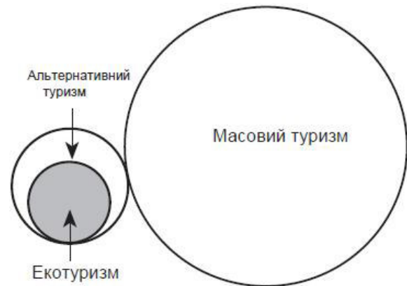
Рис. 1. Альтернативний туризм і екотуризм - концептуальний підхід

Обговорення екотуризму в межах контексту альтернативного туризму (Alternative tourism) не може бути відірвано від контексту масового туризму. У туристичній літературі екотуризм зазвичай розглядається як форма "альтернативного туризму", яка робить акцент на природні, а не на культурні пам'ятки. Щоб оцінити цей цінносно-орієнтований зв'язок, необхідно переглянути основні концептуальні події, які відбулися в галузі вивчення туризму починаючи з 60-х років минулого століття. В післявоєнний період переважала "захисна" концепція, яка мала тенденцію розглядати туризм не критично, як економічну перевагу для більшості туристичних дестинацій. Таким чином виник сектор масового туризму. Протягом 1970-х років, "захисна" концепція зіткнулась з "запобіжною" концепцією, що розглядала масовий туризм у більш критичному світлі через його негативні наслідки. Наступним логічним кроком у цій еволюції стала поява на початку 1980-х років "адаптаційної" концепції, яка представила поняття "альтернативного туризму" як доброякісну альтернативу масовому туризму. Виходячи з таких позицій, екологічний туризм логічно підпадає під альтернативний туризм. Масовий туризм стоїть у цій моделі як взаємовиключна категорія туризму, розділена так званим "концептуальним бар'єром" (Clarke, 1997). Саме така структура (рис. 1) є поширеною в літературі.