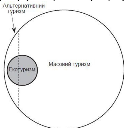
Рис. 2. Альтернативний туризм, масовий туризм та екотуризм - емерджентний підхід

яким пропонується денна екскурсія до візит-центрів природоохоронних територій [12].