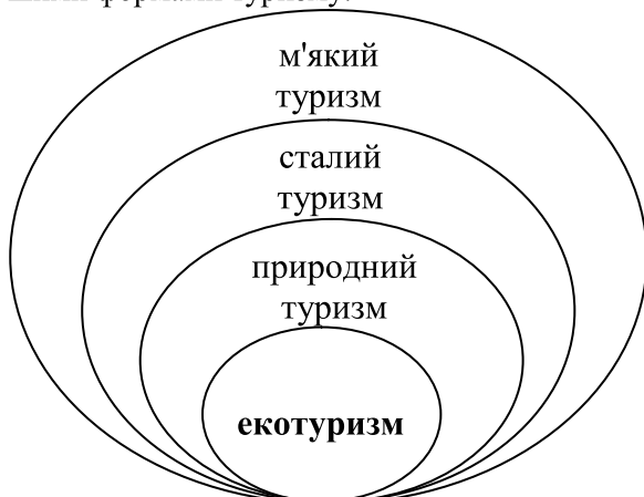
Рис. 3. Зв'язок екотуризму з іншими формами туризму

Концепція сталого туризму (Sustainable Tourism), яка виникла у 1980-х роках, як виявилось, більш суперечлива, ніж концепції екотуризму або альтернативного туризму. Хоча ідея сталості з'явилась набагато раніше в туристичній літературі, сам термін "сталий туризм" став використовуватися після того, як у 1987 році Всесвітня комісія ООН з навколишнього середовища та розвитку (WCED) випустила звіт "Наше спільне майбутнє", який популяризував концепцію "сталого розвитку". Сталий туризм був задуманий як туризм, який не загрожуватиме економічній, соціальній, культурній або екологічній цілісності туристичної дестинації на протязі тривалого терміну [10]. Він повинен відповідати тим же критеріям екологічності та впливу на соціальну сферу, як «м'який туризм», але при цьому повинен орієнтуватися на інтереси місцевого населення [9]. На рис. 3 представлено умовне зображення, що характеризує взаємозв'язок екотуризму з іншими формами туризму.