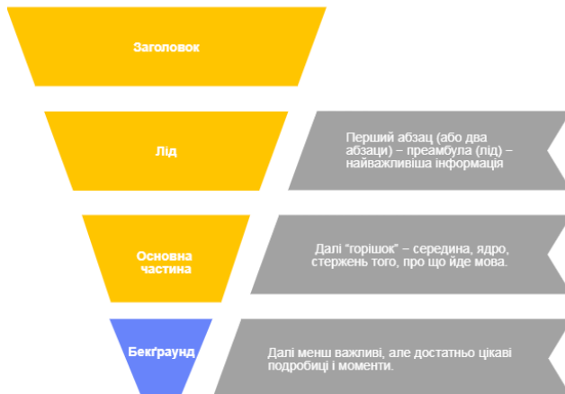
Рис. 2. Принцип «перевернутої піраміди»

Принцип перевернутої піраміди передбачає, що найважливіша інформація, – основне повідомлення, – міститься на початку тексту. Далі, за принципом віддалення, розміщуються менш важлива інформація.