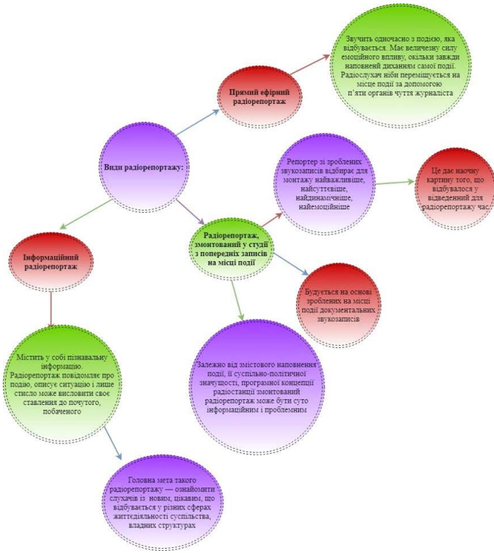
Рис. 3. Класифікація радіорепортажу (за В. В. Лизанчуком)

Схеми й таблиці відповідають принципам компактності, системності та логічності, тобто практичній реалізації наочності навчання. Доцільно зауважити, що візуалізація навчальної інформації сприяє продуктивній діяльності студентів-журналістів, активізації їхніх пізнавальних інтересів.