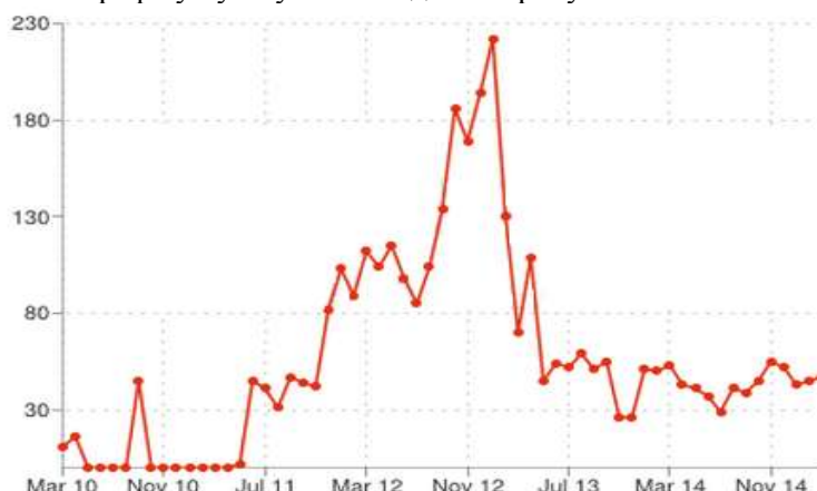
Рисунок 1. Пошуковий трафік сайту «Україна Інкогніта»

Пошуковий трафік за 2010-2014рр. представлений на рис 1. свідчить, про те, що найкращі показники пошукового трафіку були у листопаді 2012 року.