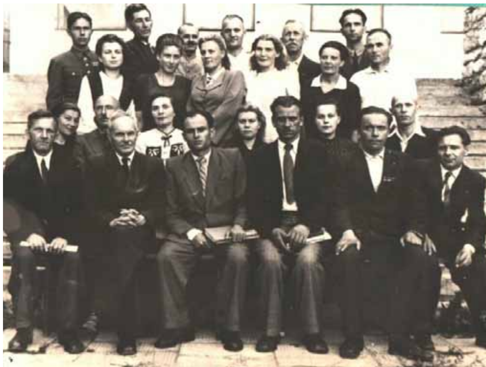
Педагогічний колектив Кременецького учительського інституту