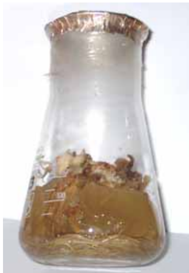
Рис. 4 Культивування кореневої культури Gentiana cruciata L. на живильному середовищі МС (D)