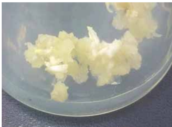
Рис. 3. Індукція ризогенезу з калюсу G. cruciata на модифікованому живильному середовищі МС (А, D) в умовах темряви

Аналіз отриманих результатів показав, що найбільш ефективною для ініціації коренеутворення з калюсної тканини G. cruciata виявилася концентрація ІОК – 1,0 мг/л у живильному середовищі, де частота ризогенезу становила – 85 %, а підвищення її вмісту в живильному середовищі до 3 мг/л інгібувало процес ризогенезу (57 %) (таблиця). Дія НОК та 2,4-Д на процес ризогенезу була позитивно помітною лише в поєднанні з ІОК.