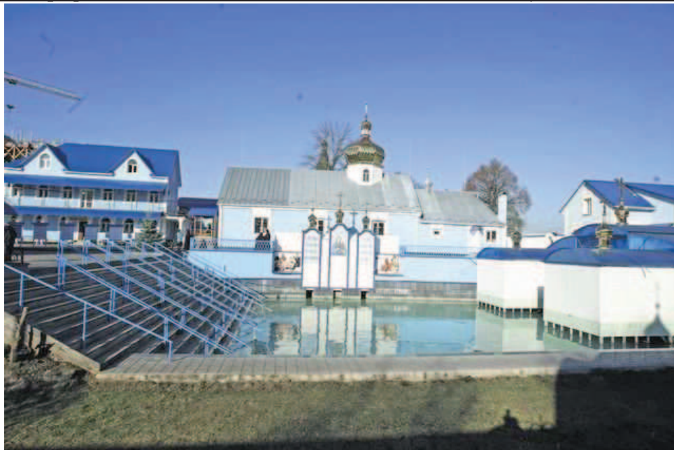
Рис.3 Джерело Святої Анни

Висновки та перспективи подальшого дослідження. Отже, сучасний стан джерел басейну річки Стохід не завжди задовільний. Наприклад, стан 5 джерел (Піщанське, Святої Трійці, Мельницьке, Квітневе та Троянівське) є задовільним. Вони добре облаштовані, добре збереженні, ознакуванні. Стан інших джерел не завжди задовільний і вимагає проведення оптимізаційних заходів: