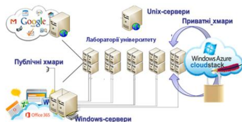
Рис. 2. Схема розгорнутої хмарної інфраструктури університету

–сервіси управління проектами, тобто можливість роботи над інноваційним проектом всередині інноваційного освітнього середовища.