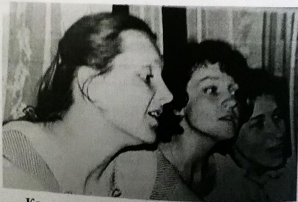
Коли душа співає: студенти-дослідники (випуск-1983)

Безмежно вдячна та з великою шаною і повагою згадую усіх викладачів, які сформували мене як майбутнього педагога, психолога, науковця.