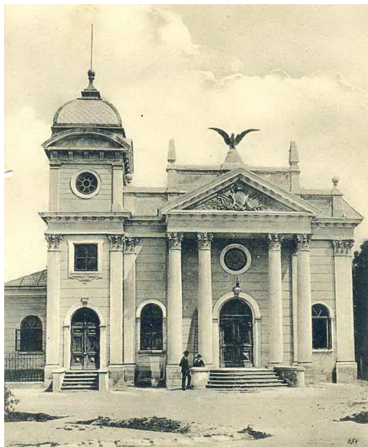
Малюнок 2. Фронтальна сторона будівлі

Події Першої світової війни негативно відбилися на стані самої будівлі. Особливих утрат зазнала бібліотека, яка була частково знищена, а частково розійшлася по приватних книгозбірнях (наявність у бережанців книг із логотипом сільської бібліотеки фіксували ще наприкінці 20-х рр.). На жаль будівля, як архітектурний шедевр міста продовжувала руйнуватись і в часи української повітової адміністрації 1918-1919 років. У 1925 р. її спробували реставрувати і вона знову стала центром сокілівського товариства яке активно продовжувало свою діяльність [1].