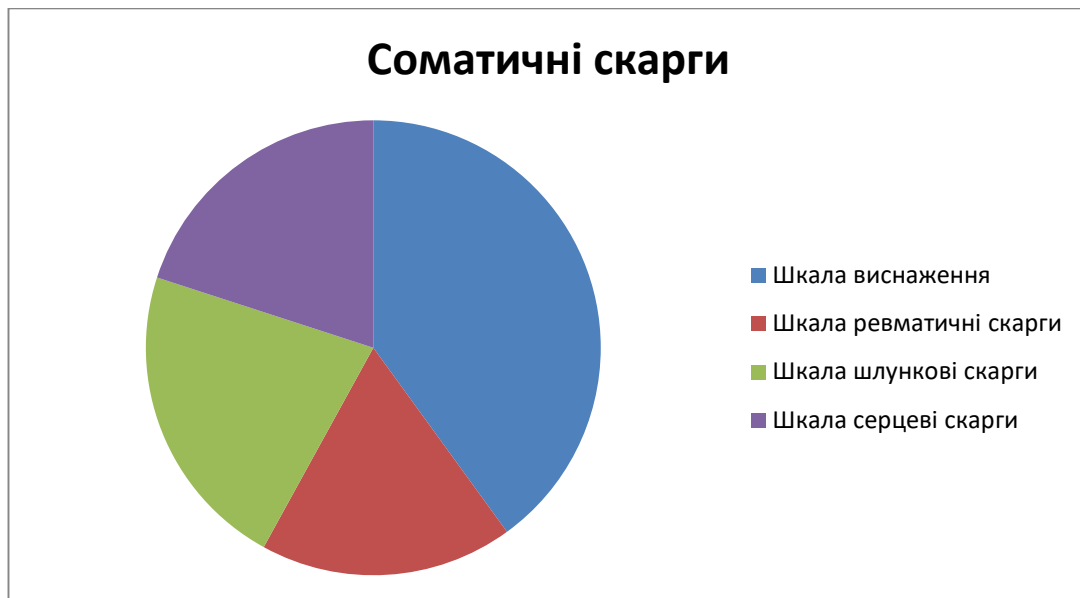
Рис.2. Розподіл показників соматичних скарг

Відповідно до результатів дослідження найбільший показник серед випробуваних – за шкалою виснаження, а найменший – за ревматичним фактором. Дана методика дозволяє оцінити соматичний стан людини на основі суб'єктивних відчуттів. Використовуючи коефіцієнт кореляції Пірсона, можна визначити взаємозв'язок між рівнем стресостійкості і частотою соматичних скарг. Коефіцієнт кореляції становить = 0,4. Даний показник вказує на те, що при зростанні даних стресостійкості збільшуються показник соматичних скарг. Чим вищі значення за методикою стресостійкості, тим рівень витривалості до несприятливих факторів нижчий і відповідно імовірність появи психосоматичних порушень зростає.