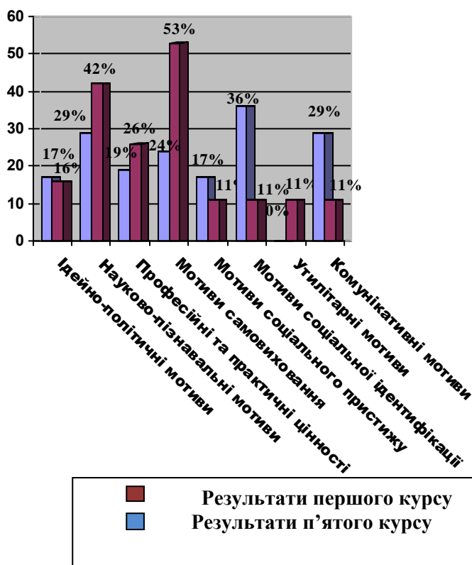
Рис. 2. Співвідношення показників мотивів виділених М. І. Алексєєвою

Порівнюючи результати методики М. І. Алексєєвої виявилось, що для студентів першого курсу домінуючими мотивами є мотиви соціальної ідентифікації (36%), комунікативні (29%) та науково-пізнавальні (29%). Тоді, як для п'ятого – мотиви самовиховання (53%), науково-пізнавальні (42%) та професійно-практичні (26%) (див. Рис. 2).