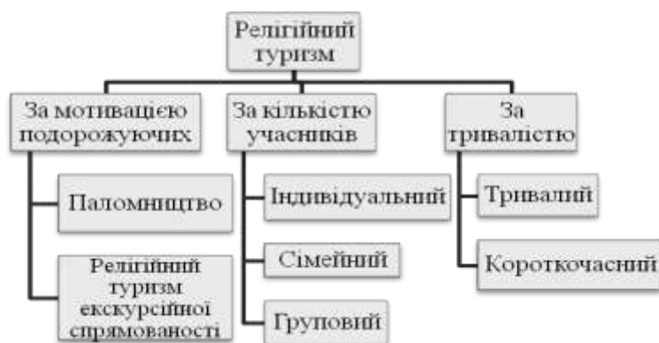
Рис.1. Структура релігійного туризму

Релігійний туризм - це самостійний вид туризму. В нього є свої різновиди (рис.1): паломницький туризм, релігійний туризм екскурсійної спрямованості, які виділяються за мотивацією подорожуючих. В першому випадку - це духовна місія, яка спонукає людину до подорожі, в другому - пізнавальна мета, посилена духовною функцією.