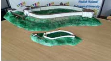
Рис. 4. Макет Кременецького замку

принтера і виконали друк моделі. У результаті нами був одержаний макет Кременецького замку (рис. 4).