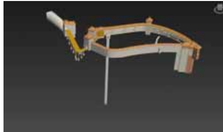
Рис. 1. Модель Кременецького замку

Користуючись архівними даними, ми відтворили їх у графічному редакторі (рис. 1).